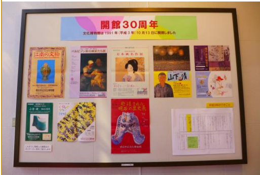
懐かしのポスターを掲示中

当館は、平成3（1991）年10月13日に開館しました。市民のみなさまに支えられて、今年で30周年です。