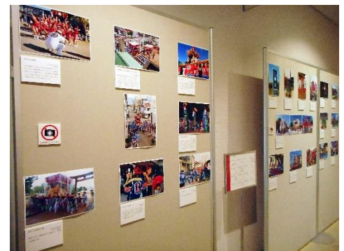
2020年度写真コンテスト展示のようす