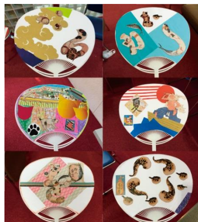
完成したうちわの一部をご紹介します