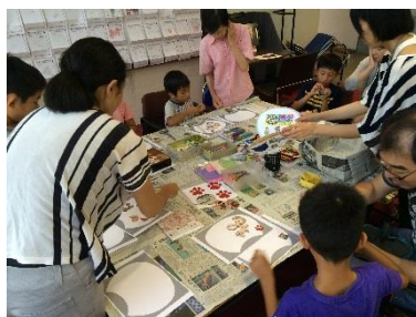
みなさん真剣です

「江戸の遊び絵づくし」展の関連イベントで、遊び絵うちわを作るワークショップを行いました。展示している作品や、今回の会場の至るところで見かける猫の足型、折り紙やマスキングテープなど、さまざまなモチーフ、材料を使ってみなさん個性あふれる素敵なうちわになりましたよ♪これで厳しい残暑もきっと乗りきれますね！