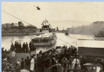
明石フェリー就航式