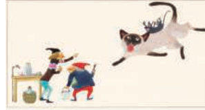
「ふしぎなのり」[「はじめてであうすがくの絵本1」より 1982年©空想工房]

画家 安野光雅氏(1926-2020)は、四方を山々に囲まれ城下町の風情がのこる島根県津和野で少年時代を過ごしました。独自の世界観をもつ絵本作品は、国際アンデルセン賞画家賞を受賞するなど国内外で高く評価され、装丁デザインや執筆活動など、その活躍は幅広い分野に及びます。本展では、画家として独立する前の教員時代に着目し、多彩なジャンルの作品を学校の授業科目に見立ててご紹介します。