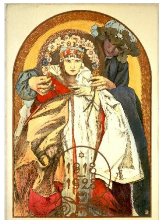
7 《1918-1928 独立 10 周年》