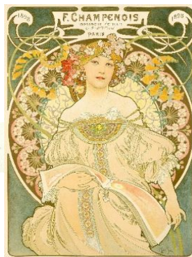
3 《夢 シャンブノア》