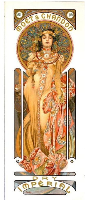
5 《ドライ・インペリアル》