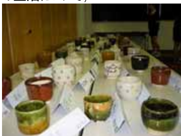
手作りのやきもの(ずらりと並んだやきものは秀作ぞろい！)