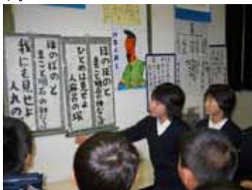
柿本人麻呂について の生活について)

3年生を引率して見学された先生方も、6年生が発表する姿を見て、「しっかりしてるなー。」と感慨深げな様子でした。6年生もこの経験を次のステップにつないで、中学校でも学習をさらに深めてくれることを期待しています。