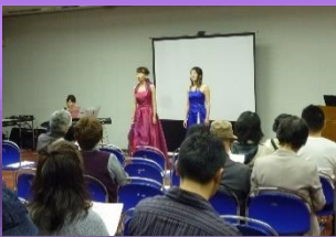
■画像はイメージです。

9月22日(火祝)、30日(水)、10月4日(日)、11日(日)、14日(水)、18日(日) 午前11時～、午後3時～(約30分)